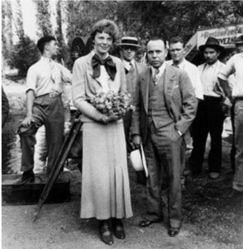
Amelia Earhart, primera mujer piloto aviador que atravesó en solitario el Océano Atlántico, con el coronel Alberto Salinas Carranza en Xochimilco, 1935. Reproducción autorizada por el INAH.

General Lázaro Cárdenas reingresó al ejército el 1 de abril de 1939 para hacerse cargo de la Dirección de Aeronáutica (1939-1940). Bajo su mando se realizaron diversas actividades: vuelos de ruta, fotografías aéreas, levantamiento de croquis, prácticas de navegación, etc.